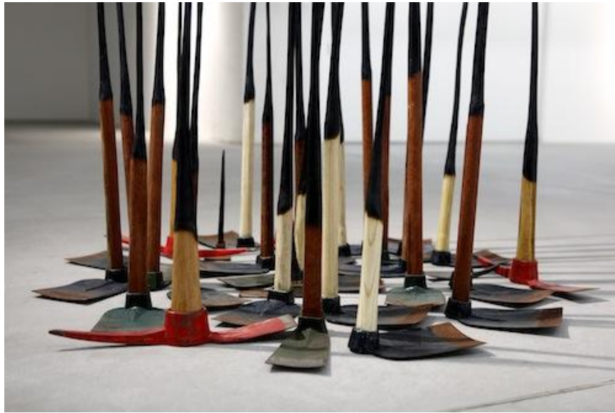
吳家俊 Withered Grass Revolution 2012 木, 鐵 尺寸大小不一