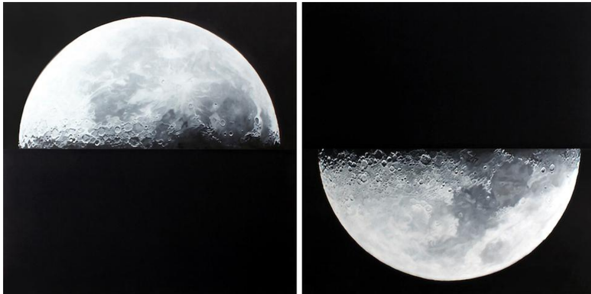
黎卓華 ½ Moon 油畫布本 140 x 140 厘米, 4面板