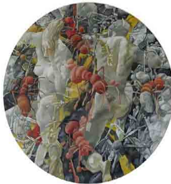
《狀元子》, 油彩, 畫布, 2008, Diameter : 230cm

藝術家作品不拘一格的組合違抗了簡單分類。也因此, 李氏站在中國傳統和當代藝術圈外, 佔着