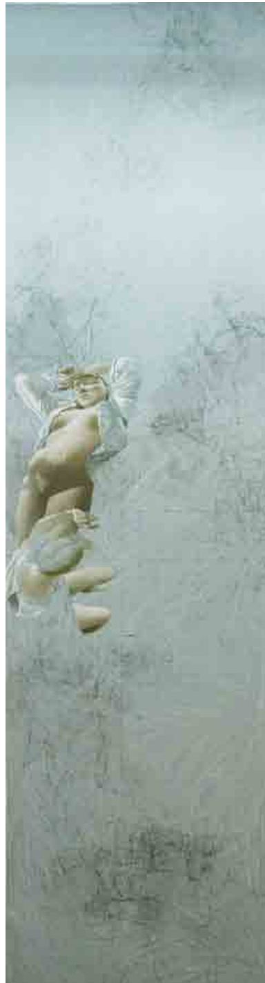
《河圖之象》(左); 《洛書之說》(右), 油彩, 畫布, 2011