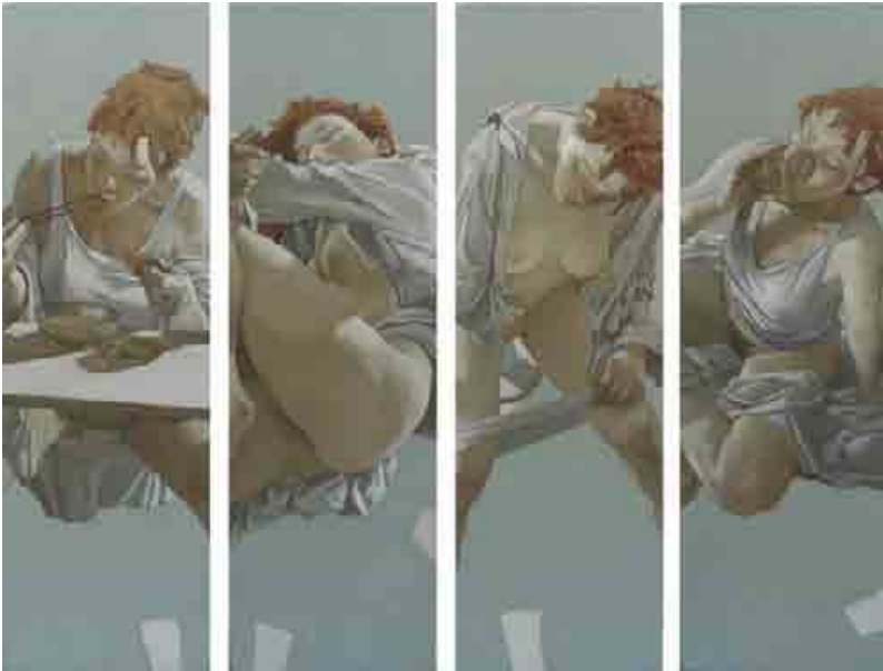
《每一天》，油彩，畫布，4 面板，119cm X 37cm each