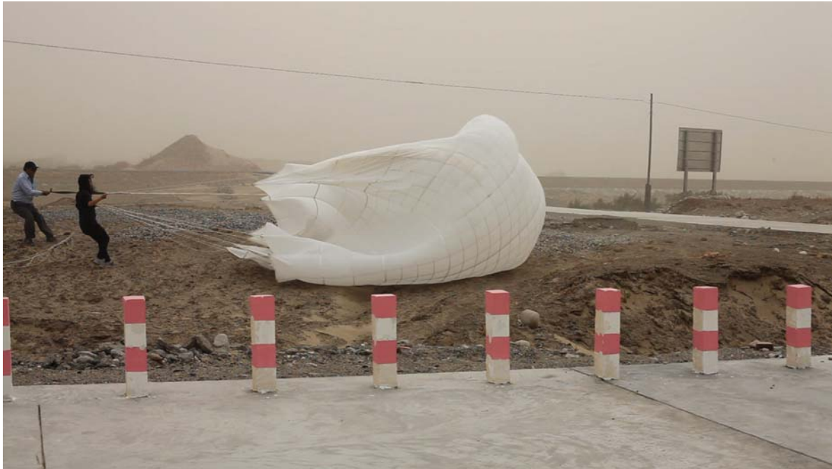
《Minor》, 2009年,張怡, Single channel video