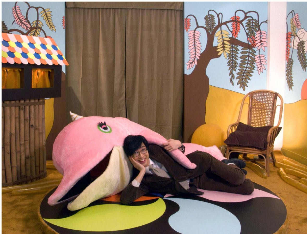
《Sang Yat Fai Lok》, 2008年,王浩然 Single channel video