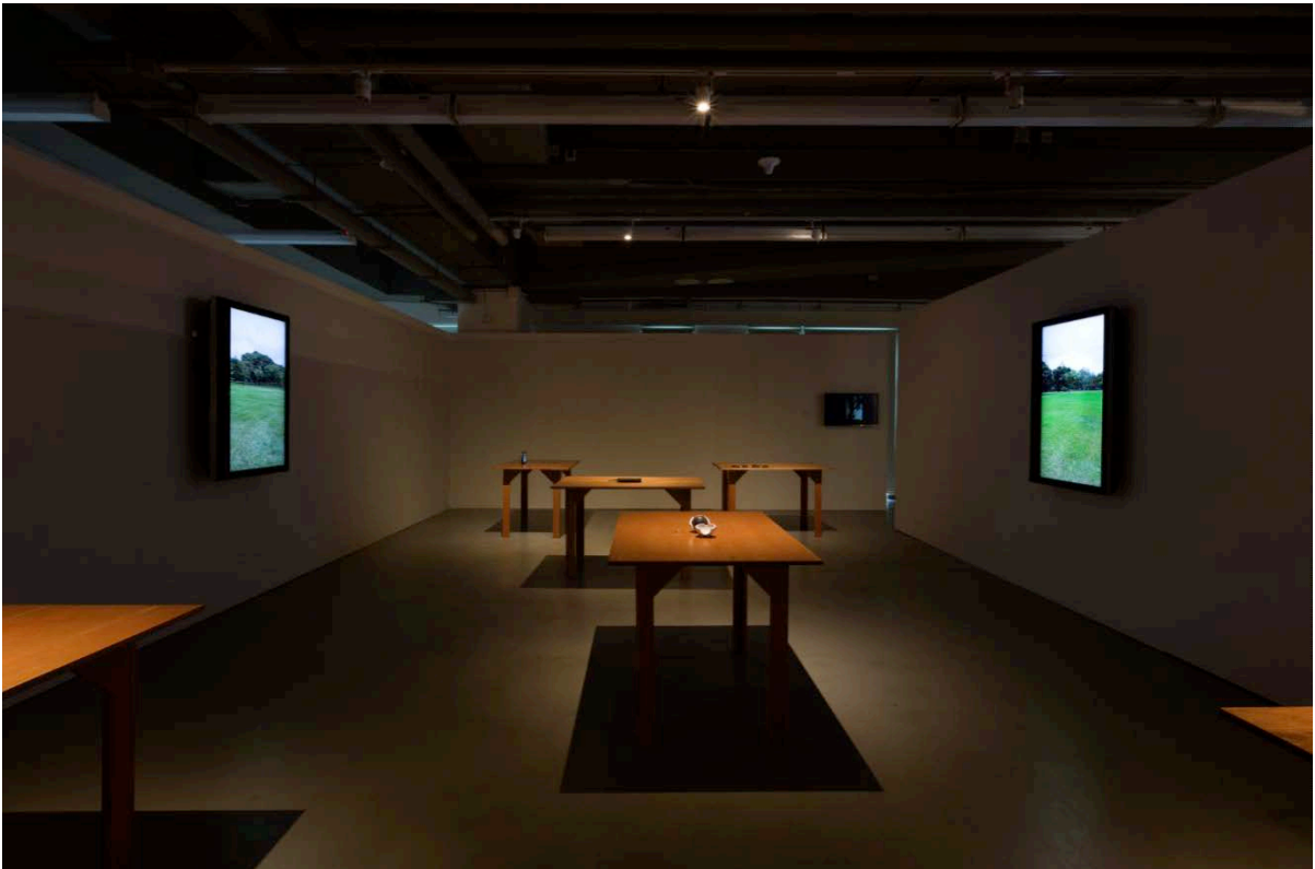
Nipan Oranniwesna, 《Speechless》(混合媒介, 尺寸可變, 2012年) (局部圖)。

http://pan.baidu.com/s/1jG3eqqU (密碼：6rsm)