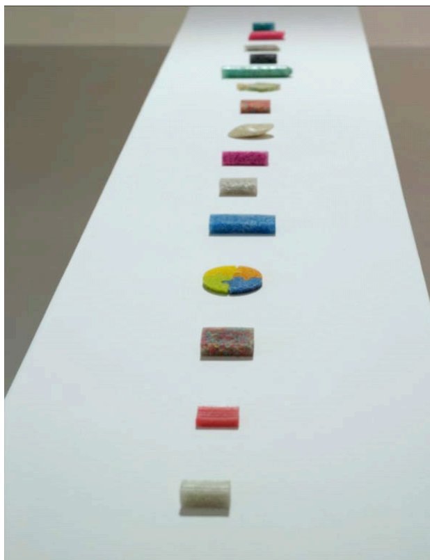
Nilo Ilarde 作品《Erased Erasers》(橡皮碎屑、鑄塑樹脂, 3 x 4 x 1 厘米, 2014 年) (局部圖)。