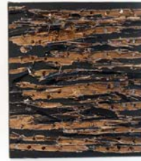
菅木志雄，《Infinite Ability》(塑膠彩、木，35 x 22 x 7.5 厘米，2011 年)、《Equalization of Space》(塑膠彩、木，35 x 22 .3 x 5 厘米，2011 年)、及《Passing Space》(塑膠彩、木，25 x 22 x 4.5 厘米，2011 年) (由左至右)。