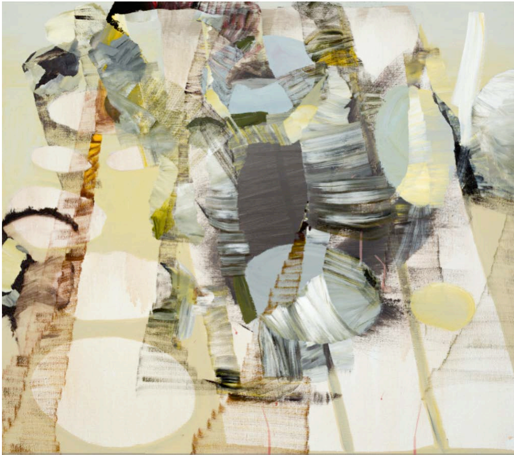
胡耀光, 《Blind Spot》(塑膠彩布本, 75 x 85 厘米, 2013 年)。